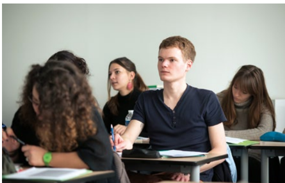
Formation de futurs enseignants en École supérieure du professorat et de l'éducation (ESPE).

Les trinômes académiques regroupent dans chaque académie l'ensemble des acteurs de l'esprit de défense. Ils ont pour vocation de concevoir les activités concourant au développement de la culture de défense. Les trinômes participent à la formation initiale et continue des enseignants lors de colloques ou d'ateliers.