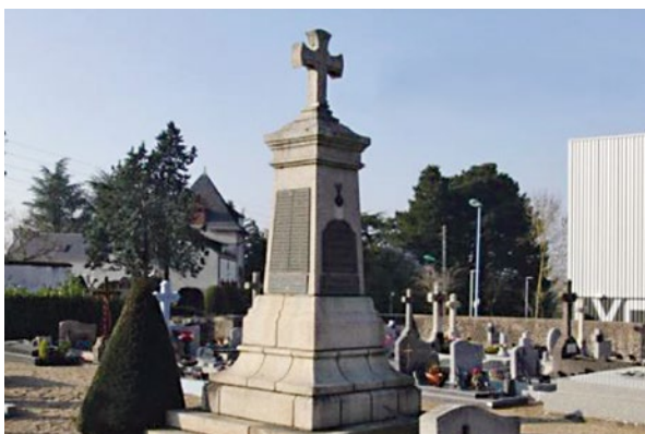
« Gorges dans la Première Guerre mondiale », travail réalisé par les élèves du lycée Charles Péguy de Gorges.

Le volontaire, qui pourra réaliser ce projet avec d'autres jeunes, choisira un sujet en lien avec le calendrier mémoriel ou les problématiques locales. Il pourra se rapprocher du service de l'ONAC-VG de son département ou d'autres institutions mémorielles (associations, fonda-