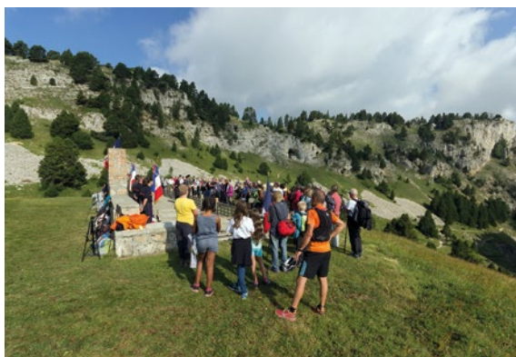
Nécropole du Pas de l'Aiguille.

Présents sur la totalité du territoire national, les nécropoles nationales et les hauts lieux de la mémoire nationale sont une porte d'entrée à l'éducation citoyenne. Un accueil personnalisé sur ces sites permet de mettre en lumière, à travers les parcours de combattants ou victimes civiles, l'histoire nationale et locale ainsi que l'histoire du site.