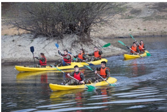
Rallye citoyen du camp de Souge, avril 2017.

Les trinômes académiques regroupent dans chaque académie l'ensemble des acteurs de l'esprit de défense. Ils ont pour vocation de concevoir les activités concourant au développement de la culture de défense. Ces activités sont variées et comprennent notamment des rallyes